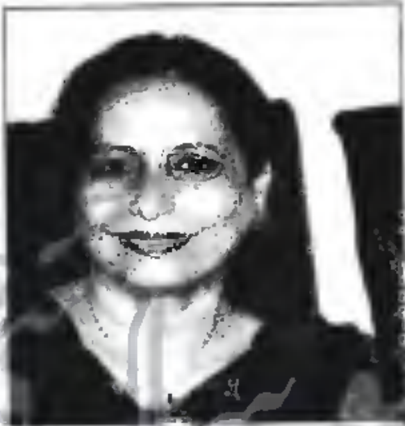
پروفیسر خالدہ سمیع

دفتر سے آتے ہی گرما گرم چائے کی پرزور فرمائش ہوتی ہے۔ جو فوراً پیش بھی کر دی جاتی